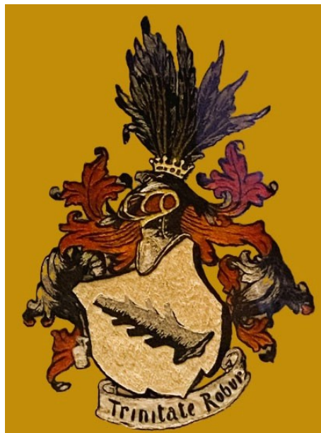
Abbildung: vererbte Verzierung für einen Kaminschirm in meinem Besitz. Man beachte den Wappenspruch: „Trinitate Robur“ - woher kommt der Text? Vielleicht weiß einer das..

https://lippelex.de/index.php?title=Schönfeld,_Familie,_17._Jahrhundert-